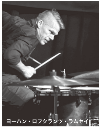
ヨーハン・ロフクランツ・ラムセイ