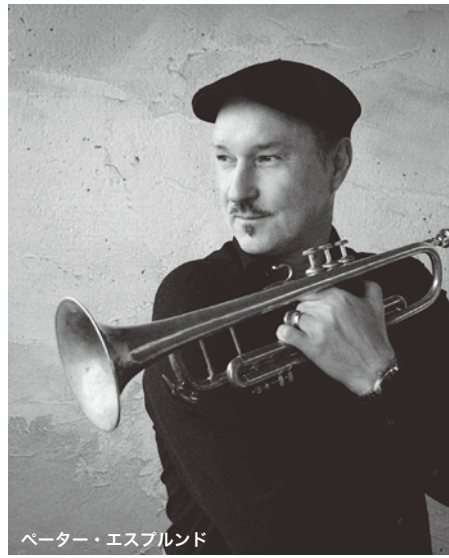
ペーター・エスブルンド