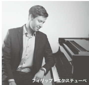
フィリップ・エケスチューベ