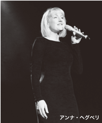
アンナ・ヘグベリ