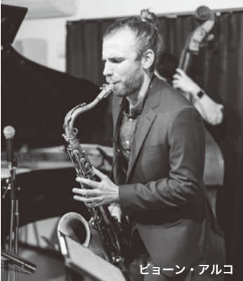
ビョーン・アルク