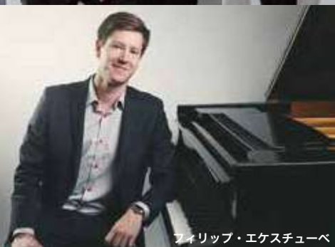
フィリップ・エケスチューベ

昨年スウェーデンのナショナルデー 500周年を記念して行い大好評を博したスウェーデン・ジャズ・ウィーク。今年もスウェーデンを代表する魅力溢れるアーティストが集合!さらに中村健吾など日本在住のアーティストも参加して北欧スウェーデンの温かく素敵なジャズをお届けします。