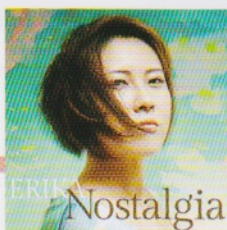
Nostalgia ¥3,000 (税抜)