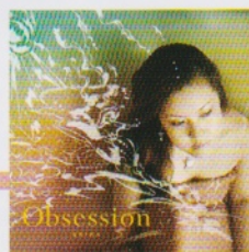
Obsession ¥3,000 (税抜)