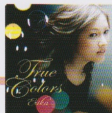
True Colors ¥3,000 (税抜)